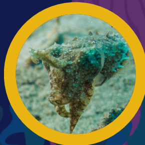
Juvenils de sèpia Juveniles de sepia