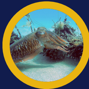
Sèpies adultes Sepias adultas