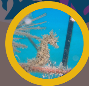
Cavallets de mar Caballitos de mar