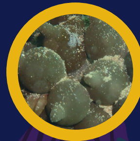
Ous de sèpia Huevos de sepia